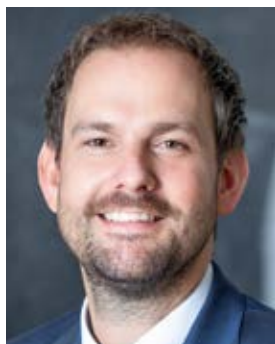
Bastian Rosenau Landrat des Enzkreises